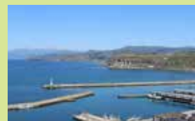
宮の森公園駐車場

町内5ヶ所に整備された湧水施設「生命の泉」の1つで、東屋で休憩することができます。