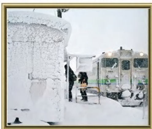
『豪雪の駅』 越知俊行(東京都荒川区)