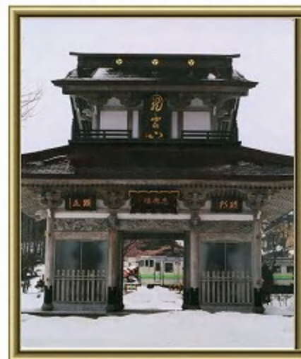
『山門駆ける』 真鍋 公(函館市)