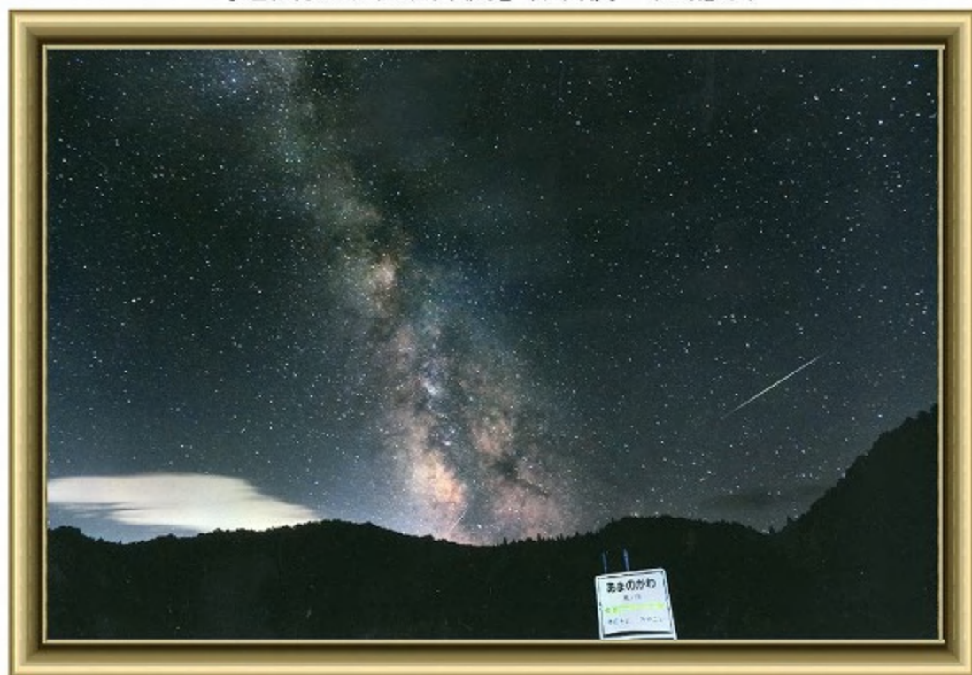
『名残りの天の川銀河』 保科俊一(函館市)